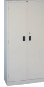
両開書庫 SR-9418A [SR9418-F] 付属品/棚板4枚・カギ1本 880(W)×380(D)×1790(H) mm