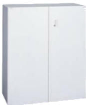
両開保管S 下型1050 BU-S5 900(W)×450(D)×1,050(H) mm