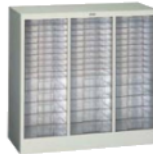
整理庫B4 3列大5小10 SKB3-15A 922(W)×400(D)×880(H) mm 引き出し内寸法 265(W)×370(D)×30(H) mm / 10段 265(W)×370(D)×65(H) mm / 5段