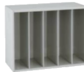
図面ファイル 上下型700 BU-M31 900(W)×450(D)×702(H) mm