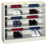
シューズボックス3段 SX-31 [SX31-F1] 1,000(W)×330(D)×900(H) mm