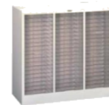
整理庫B4 3列20段 SKB3-20A 922(W)×400(D)×880(H) mm 引き出し内寸法 265(W)×370(D)×30(H) mm / 20段