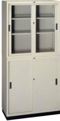
引違い書庫 ガラス SG-0940A [SG0940-F1] 付属品/棚板2枚・カギ1本 880(W)×400(D)×880(H) mm