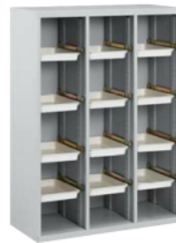
長靴用シューズボックス 下 SX-N34 [SXXN34-F] 900(W)×380(D)×1,220(H) mm