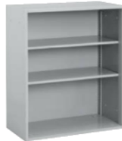
オープン3 上下型1050 BU-K50 900(W)×450(D)×1,050(H) mm