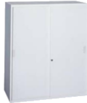
引違保管S 上下型1050 BU-N5 900(W)×450(D)×1,050(H) mm