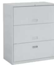
ラテラル3段 下型1050 BU-L51 900(W)×450(D)×1,050(H) mm