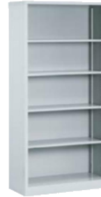
オープン書庫 SO-9418AY [SO9418-F] 付属品/棚板4枚 880(W)×400(D)×1790(H) mm