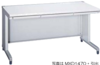
写真は MXD1470 + 引出

MXD1870 1,800(W)×700(D)×700(H) mm MXD1670 1,600(W)×700(D)×700(H) mm MXD1470 [SD1470-F1] 1,400(W)×700(D)×700(H) mm MXD1270 [SD1270-F1] 1,200(W)×700(D)×700(H) mm MXD0880 800(W)×800(D)×700(H) mm