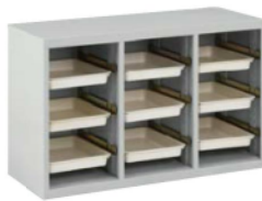
長靴用シューズボックス 上 SX-N33 [SXXN33-F] 900(W)×380(D)×570(H) mm