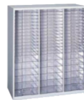
整理庫20段 下型1050 BU-P53 900(W)×450(D)×1,050(H) mm 引き出し内寸法 265(W)×370(D)×30(H) mm / 14段 265(W)×370(D)×65(H) mm / 6段

※ 下型1050キャビネットには、ビジネスユニットベース (BU-B) が必要です。