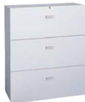
コンビC3段 下型1050 BU-C52 900(W)×450(D)×1,050(H) mm