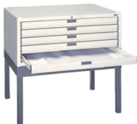
マップケース A1 MPC-A 付属品 / カギ1本 978(W)×740(D)×415(H) mm 引き出し内寸法 882(W)×660(D)×47(H) mm