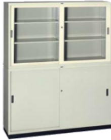
引違い書庫 ガラス SG-1540A [SG1540-F1] 付属品/棚板4枚・カギ1本 1,500(W)×400(D)×880(H) mm