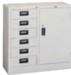
コンビ書庫6段 SC-6A 880(W)×400(D)×880(H) mm